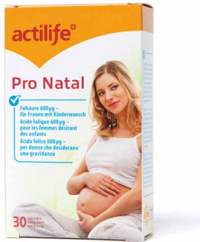
Migros Actilife Pro Natal 600 µg Folsäure/Tablette