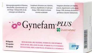
Effik Gynefam Plus 800 µg Folsäure/Tablette