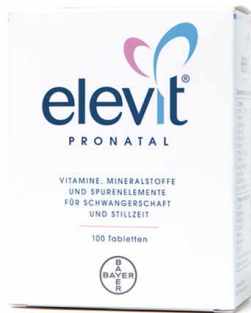
Elevit Pronatal 800 µg Folsäure/Tablette