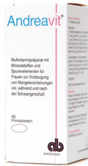
Andreabal Andreavit 600 µg Folsäure/Tablette