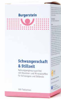
Burgerstein Schwangerschaft und Stillzeit 600 µg Folsäure/Tablette