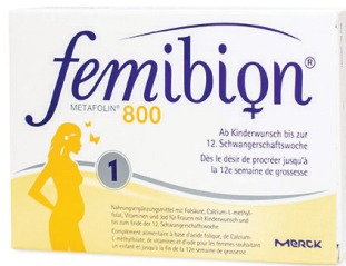
Iromedica Femibion 1: 800 Folic Acid Plus 800 µg Folsäure/Tablette