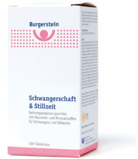
Burgerstein Schwangerschaft und Stillzeit 600 µg Folsäure/Tablette