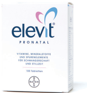
Elevit Pronatal 800 µg Folsäure/Tablette