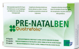
Effik Pre-Natalben 400 µg Folsäure/Tablette