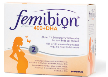
Iromedica Femibion 2: 400 Metafolin plus DHA 400 µg Folsäure/Tablette